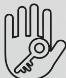
TTLock для IOS и Android