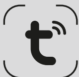
приложение TUYA WI-FI