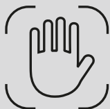
распознавание вен ладони